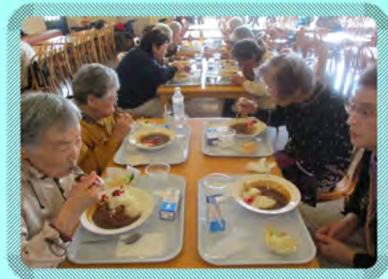
みんなで食べるとおいしいね。