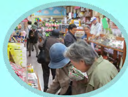
お土産買うのも楽しいわ。

10月16日(火)・18日(木)に、しおさいサロンの外出レクで「ソレイユの丘」に行ってきました。両日とも多くの方が参加され、とても楽しいひと時を過ごすことができました。また、お手伝いいただいたボランティアの皆様、ありがとうございました。