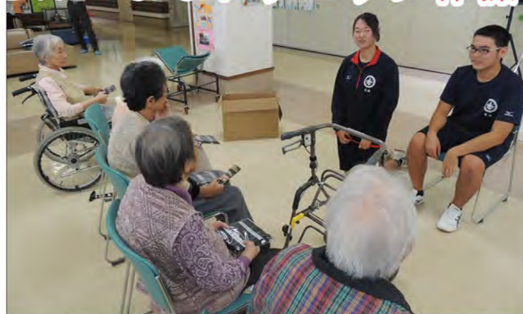
生徒さんとの会話も楽しみです

毎年恒例となりました、海洋科学高等学校の生徒さんが来訪され、「トラビック体操(交通安全とエアロビックを掛け合わせた造語で、神奈川県警察と神奈川県エアロビック連盟が共同開発した高齢歩行者向け交通事故防止のための体操)」を行って頂きました。冒頭神奈川県警察の方から、高齢者を狙った詐欺被害が未だに多発しており注意を頂きたいとの話とチラシを頂きました。その後は童謡をアレンジした歌に合わせてご利用者様と生徒さん5グループに分かれての体操を1時間程度行い交流を深めました。