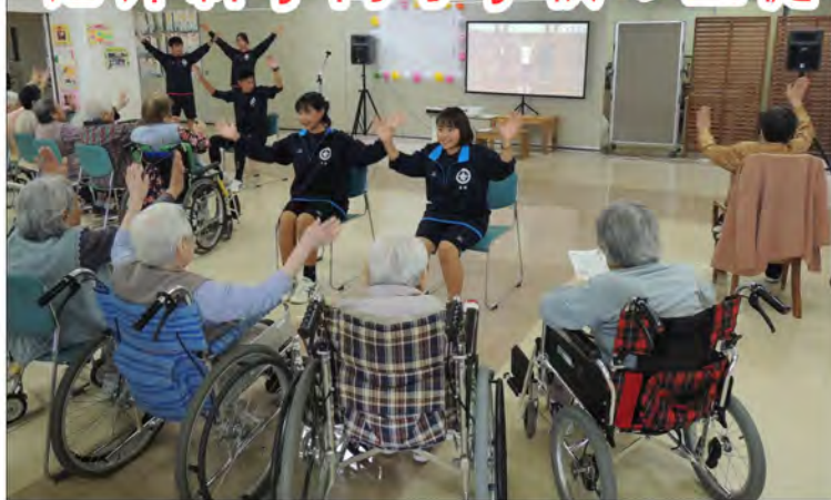
替え歌に合わせて体操を行いました