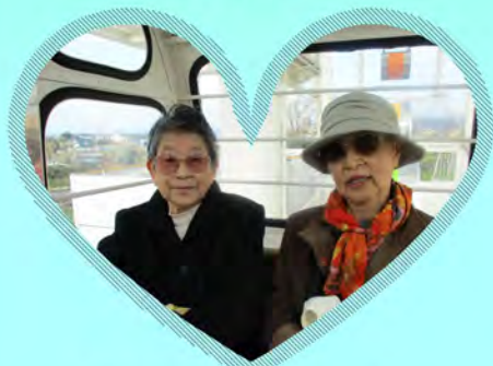
観覧車に乗りたかったの。