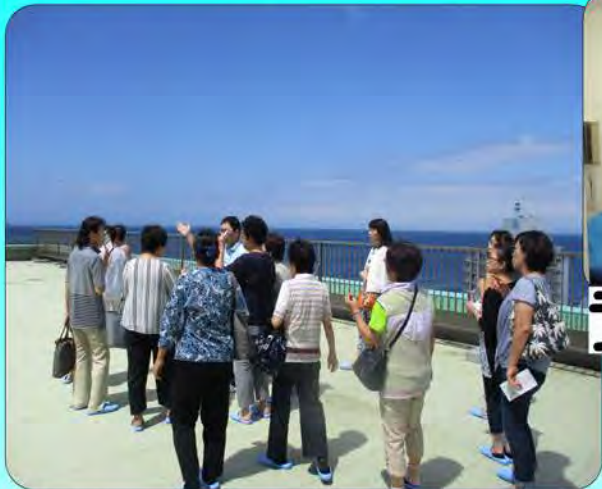
快晴の屋上をご案内中です