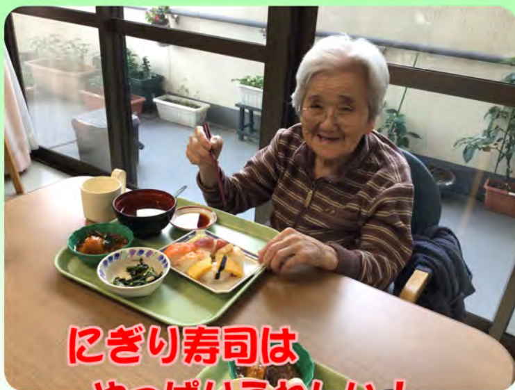
にぎり寿司は やっぱりうれしい! 皆さん笑顔になりました!