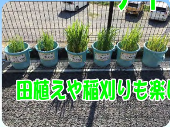
田植えや稲刈りも楽しみました!