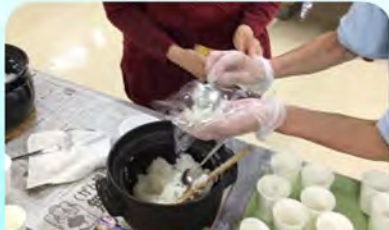
美味しいおにぎりになりました!