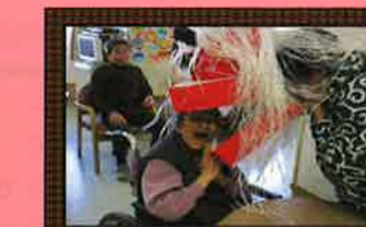
新年会。今年もいいことありますね。