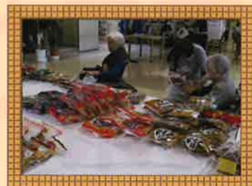
月に一度の売店で楽しくお買いもの♪