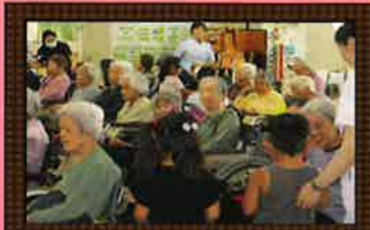
近隣の子どもたちとの交流