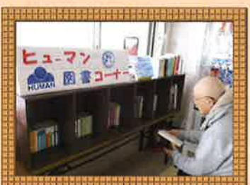
図書コーナーで、ひとやすみ