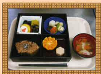
お正月の行事食です。