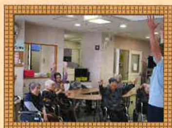
毎日の体操は欠かせません。