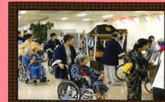
夕涼み会で盆踊り