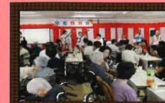
最大行事の敬老祝賀会