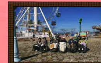
秋の遠足 ソレイユの丘