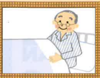
おはようございます！