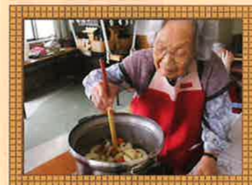
お料理教室では、参加されたご利用様が協力しあって調理を行い、楽しみながらいただけます。