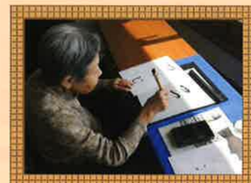
書道教室では毎月、見事な作品が出来あがります。

施設に入所されたご利用様がどのように生活されているのか、一般的な一日のお過ごし方をご紹介します。