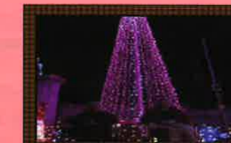
イルミネーションツアーもあります。