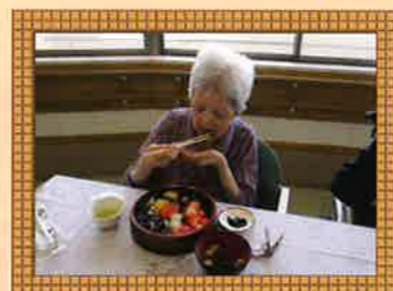
誕生月にはお寿司などで食事会を行います。