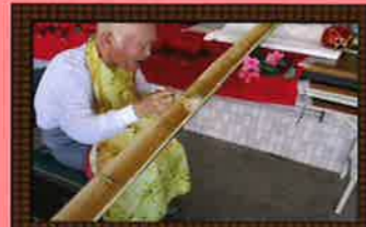
夏には、楽しい流しそめん