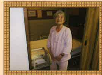
おやすみなさい。また明日。