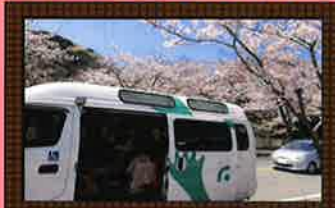
お花見ドライブツアー