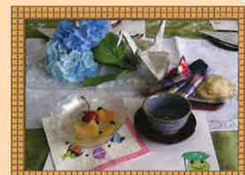
和み会では季節を感じるお茶菓子をいただきます。