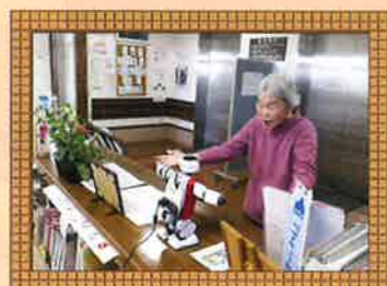
パルロクンと体操