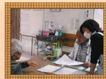
お医者さんの往診。安心して生活できます。