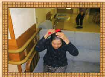
起床後、お着替え、洗顔などを行います。