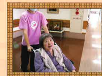
サッパリしました。