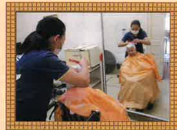
週に一度の出張理髪。きれいになったでしょ？