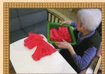
お手伝い。いつもありがとうございます。